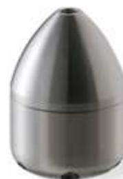
Ugello Ogiva Inox