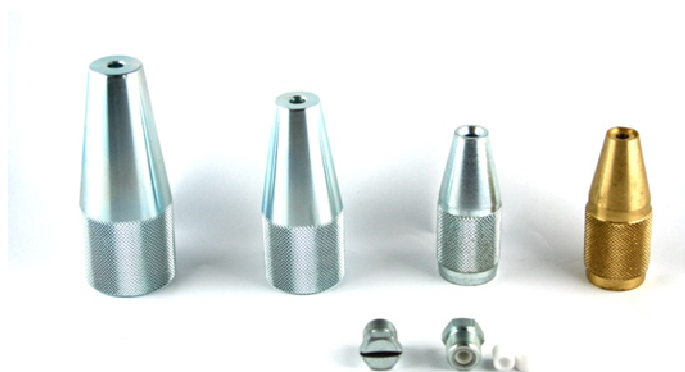
Categoria ET 7

* Per ordinare ug. in acciaio Inox, indicare I dopo il codice: es. 15160.04CI - Ug. ET 6 1" Inox Ins./ceramica