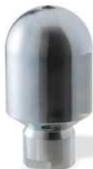
Ug. Pesante Testa Tonda

* Per ordinare ug. in acciaio Inox, indicare I dopo il codice: es. 12340.01C - Ug. Pesante TC 1" Inox Ins./ceramica