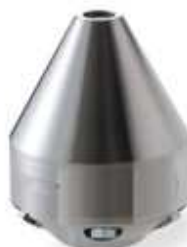
Ug. Pesante TConica Ø 110