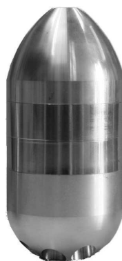
ET 5 L