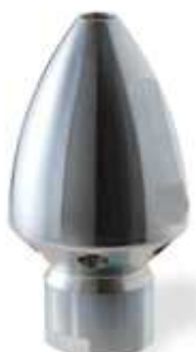
Ug. Pesante Testa Conica