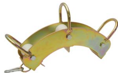
Banana deviation roller Passatubo interno a banana