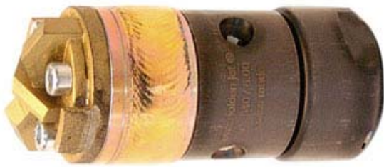
CUTTERS WITHOUT IMPACT UGELLI A FRESA SENZA IMPATTO Working pressure: up to 150 bar Pressione di lavoro: fino a 150 bar

Calcareous layers, concrete or concrete sludge can be milled out with them as well roots and wood. Sono particolarmente adatti per fresare strati di calcare, incrostazioni di cemento, radici e legno.